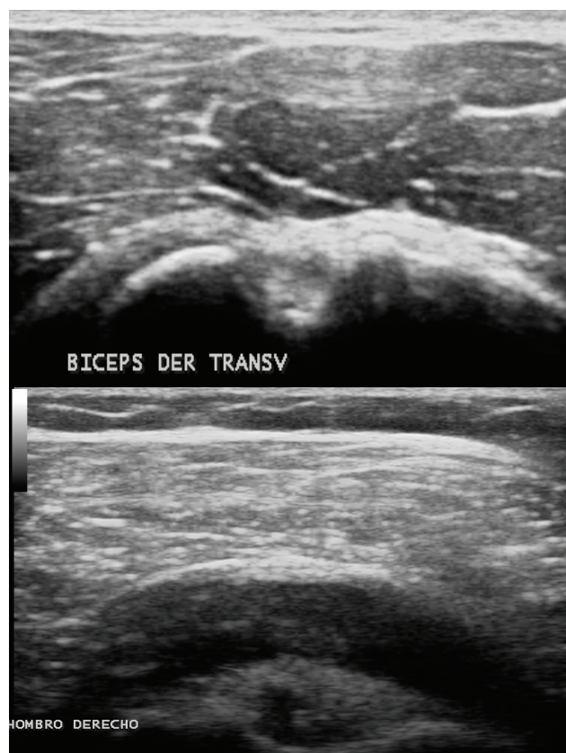
Figura 2. Arriba: imagen ecográfica de porción larga del tendón del bíceps corte transversal. Abajo: distensión de la bursa subacromiosubdeltoidea (bursitis) con distensión de la vaina sinovial del bíceps (tenosinovitis) en paciente femenina de 72 años con polimialgia reumática.

Por el contrario, si la distensión de la vaina del bíceps se asocia a distensión de la bursa subacromiosubdeltoidea (bursitis) tiene grandes posibilidades de ser una rotura del manguito rotador. Las roturas parciales y las tendinosis del bíceps, el desgarro del subescapular y la distensión de la bursa subescapular también pueden